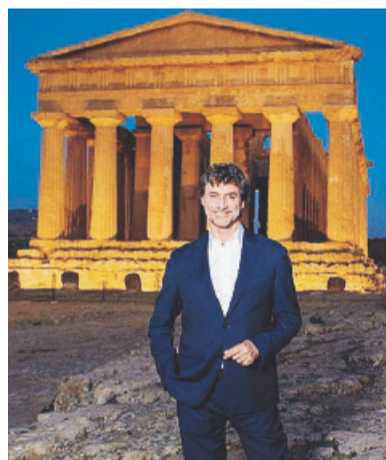
ALBERTO ANGELA Ad Agrigento

Tra Agrigento, Assisi, Siena, Matera, Alberobello, Cerveteri e Tarquinia, Milano e il suo «Cenacolo» nelle tante Meraviglie italiane che conosciamo - o crediamo di conoscere - Alberto Angela rivela l'impronta di urbanisti sapienti e grandi mecenati, artigiani sconosciuti o geni assoluti come Giotto e Leonardo. Siti dell'Unesco, ma non solo: un viaggio