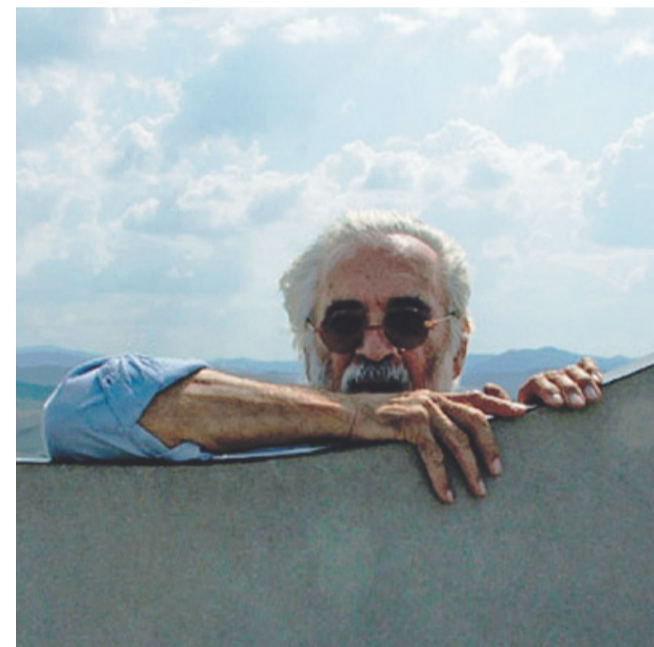
MAURO STACCIOLI, AVEVA 80 ANNI In alto, il maestoso Cerchio di fronte alla Galleria Nazionale di Arte Moderna di Roma; sotto, la sua «colonna» nel parco La Palomba di Matera