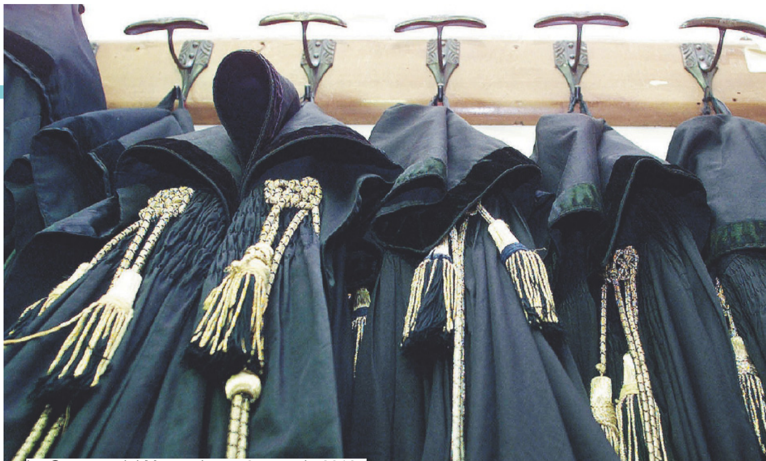
La Gazzetta del Mezzogiorno, 3 gennaio 2018